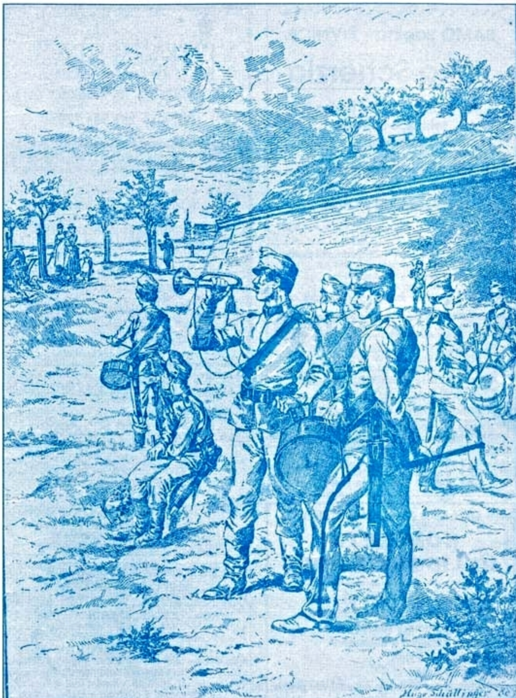
(Ilustrace k článku Břevnovští zeměbranci.) Nedaleko zeměbraneckých kasáren na Pohofelci rozkládalo se pod hradbami Strahova voňné cvičiště, kam chodili vojáci nejen sňít, ale též cvičit na hudební nástroje. Protože c. k. plukovní hudba – to bývalo něco. Kresba je ze začátku 20. století.